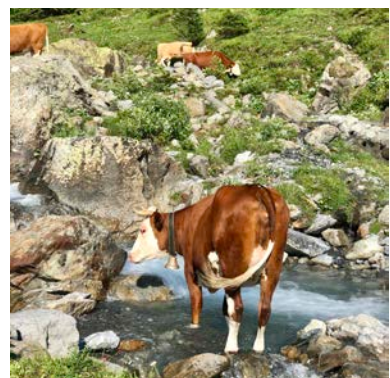
Ku på beite, Sveits.