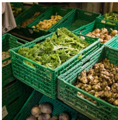
ØKOUKA, matens opprinnelsestu, Bergsmyrene