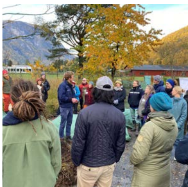
Nettverkssamling Aurland