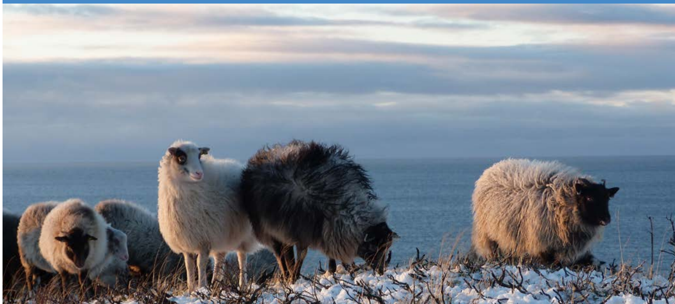
Gammelnorsk sau på utegang. Sørværet villsau.