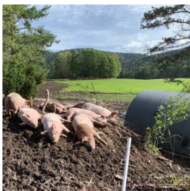
Søndre Veholt gård.

Som ny produsent er det viktig å ha oversikt over markedsmulighetene for økologisk produksjon. Hva er status for økologisk omsetning for ulike produksjoner i dag? Hvilke salgskanaler finnes for de ulike produktene, både store og små volum. Hva bør man tenke på rundt avsetning av råvaren eller foredlet vare som produseres? Webinaret gir et overblikk og det deles erfaring med foredling og salg av egne produkter.