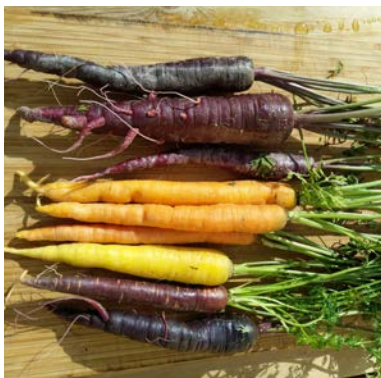
Gulrøtter i farger.

I økologisk landbruk er forebyggende tiltak på lag med naturen det viktigste grepet innen plantevern. Vekstskifte er såleis forebyggende i forhold til ugras og oppformering av skadegjørere. Direkte tiltak som fysiske, kjemiske, biologisk og termiske metoder er neste prioritet, ut fra økologiske prinsipper. Tiltakene vektes dels mot hvor kritisk det er for kulturen og dels mot praktisk mulige løsninger.